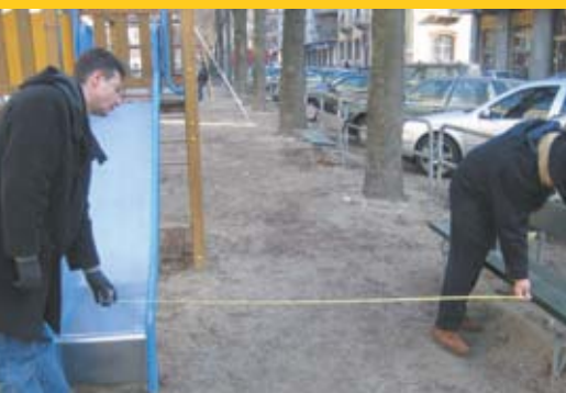
In questa pagina, foto di tecnici che verificano caratteristiche e collocazione delle attrezzature.

Le modalità specifiche per la manutenzione e il controllo delle aree sono indicate nella norma tecnica EN 1176-7 "Attrezzature per aree da gioco - Guida all'installazione, ispezione, manutenzione e utilizzo".