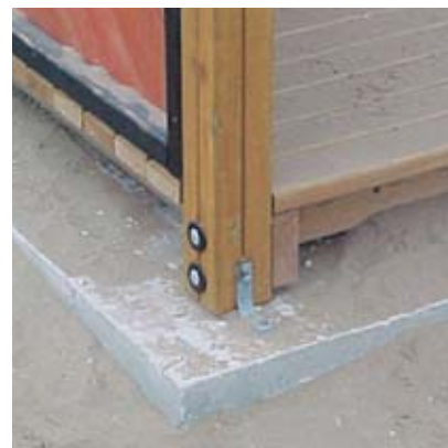
Pericolo connesso a cemento esposto.