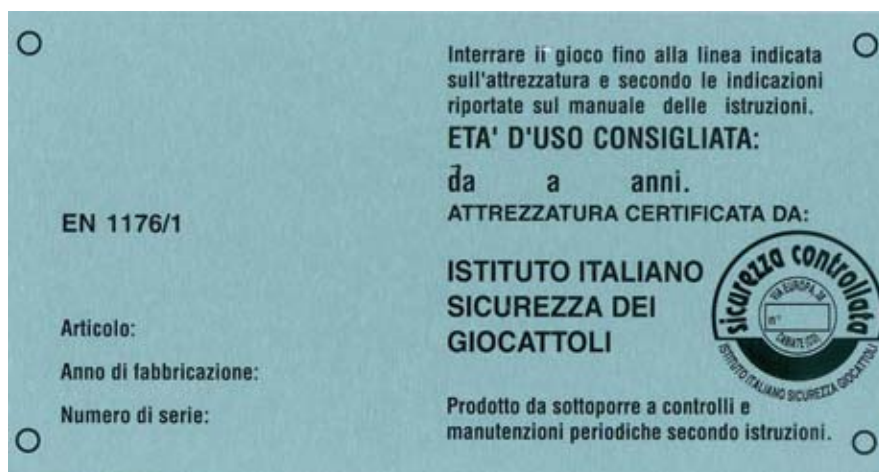
Esempio di indicazioni per attrezzature.

b) Le superfici sulle quali installare le attrezzature devono essere idonee ad assorbire l'impatto di eventuali cadute (EN 1177).