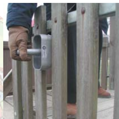
Verifica degli spazi di intrappolamento della testa.